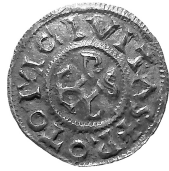
MOESGAARD, A TENTH-CENTURY HOARD OF COINS (1)